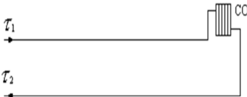
Рисунок 2 – Схема присоединения теплопотребляющих установок потребителей к тепловым сетям

В Дмитриевском сельском поселении Заволжского муниципального района Ивановской области используется закрытая система теплоснабжения. Схема подключения к тепловым сетям с непосредственным присоединением СО. Данная схема присоединения теплопотребляющих установок потребителей к тепловым сетям представлена на рис.2.